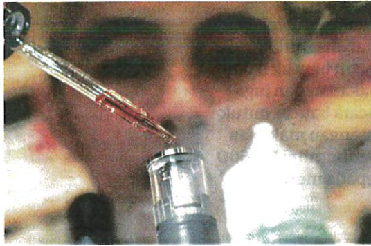
DUTI eksais ke atas produk cecair atau gel mengandungi nikotin perlu dikenakan bagi mengurangkan penggunaan vape.

“Kerajaan menyokong inisiatif Generational Endgame (GEG) dan bersetuju bahawa separuh daripada hasil duti eksais ini akan