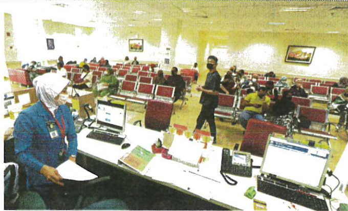
Prime Minister Datuk Seri Anwar Ibrahim says the government will channel half of the excise duties from vape products to improve healthcare services.