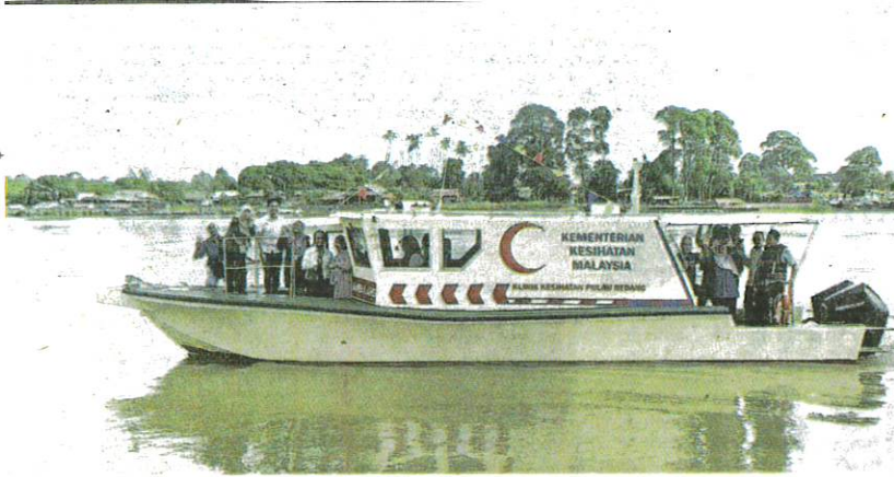
SALAH sebuah bot ambulans untuk kegunaan penduduk di Pulau Redang dan Perhentian di Terengganu.

AKHBAR : KOSMO MUKA SURAT : 14 RUANGAN : NEGARA