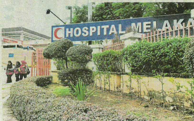
Kerajaan akan membina blok wanita dan kanak-kanak dengan kapasiti 476 katil dengan kos hampir RM700 juta bagi mengurangkan kesesakan di Hospital Melaka.

Bagi mengurangkan kesesakan di Hospital Melaka, kerajaan