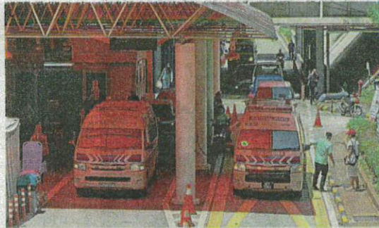
Towards the future: Health experts welcome the increased allocation but say there is still a long way to go.

The Hartal Doktor Kontrak group said the RM3bil allocation for hiring